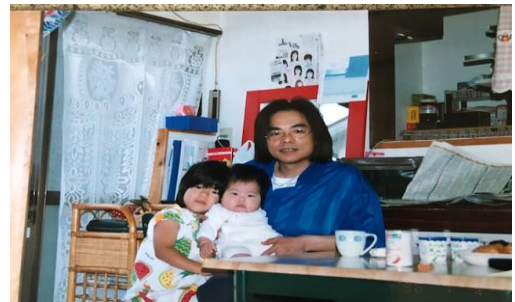
23年前、髪結床をオープンした頃

私の人生が決まった瞬間でした。十七歳と二ヶ月。私は美容師人生を導かれるような形で歩くようになったのでした。