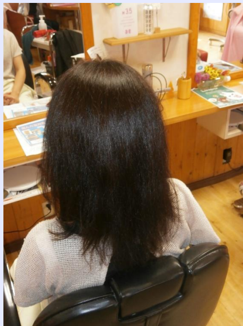
創作カット・電トリカラー